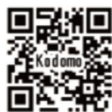
ライオン歯科材料株式会社の情報ページ