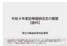
厚生労働省公式動画 令和4年度診療報酬改定の概要(歯科)